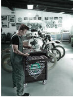
Exklusiver Werkstattwagen im Tool Rebel Design