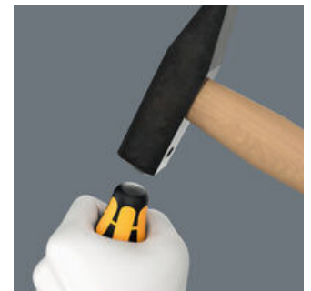
Der Schraubmeißel ist mit einer integrierten Schlagkappe zur Erhöhung der Lebensdauer und Reduzierung der Splittergefahr ausgestattet. Dennoch gilt grundsätzlich: Schutzbrille tragen!

Webink https://www.wera.de/de/05136033001