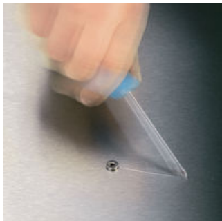
Mittels eng fokussiertem Laserlicht wird eine scharfkantige Oberflächenstruktur erzeugt. Wera Lasertip krallt sich im Schraubenkopf fest und verhindert das Herausrutschen aus dem Schraubenkopf. Bei Schlitz, Phillips und Pozidriv.