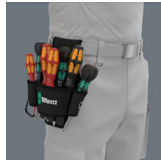
Die Gürtel-Tasche ist aus robustem Material und kann am Gürtel befestigt werden.