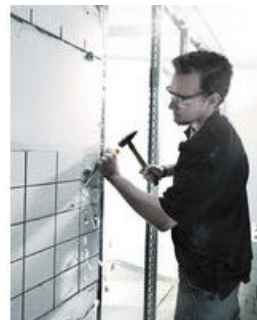
Der Wera Schraubmeißel zum Schrauben, Meißeln, Stemmen und Lösen festsitzender Schrauben. Mit mehrkomponentigem Kraftform Griff für schnelles und schonendes Arbeiten.