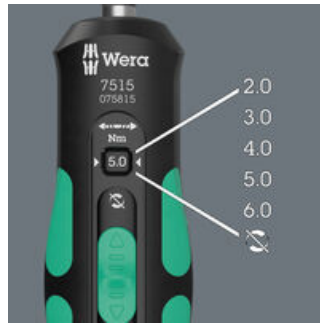
Fünf wählbare Anzugsdrehmomente (2,0; 3,0; 4,0; 5,0; 6,0 Nm) und eine Fest-Stellung (Torque Lock) für unbegrenzte Löse- und Anzugsmomente.