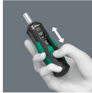
Einfache Einstellung der wählbaren Anzugsdrehmomente.