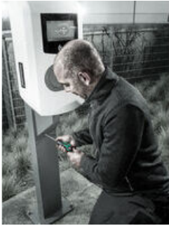
Drehmomentschraubendreher mit Schnelleinstellung