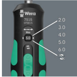
Fünf wählbare Anzugsdrehmomente (2,0; 3,0; 4,0; 5,0; 6,0 Nm) und eine Fest-Stellung (Torque Lock) für unbegrenzte Löse- und Anzugsmomente.