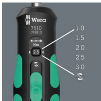
Fünf wählbare Anzugsdrehmomente (1,0; 1,5; 2,0; 2,5; 3,0 Nm) und eine Fest-Stellung (Torque Lock) für unbegrenzte Löse- und Anzugsmomente.