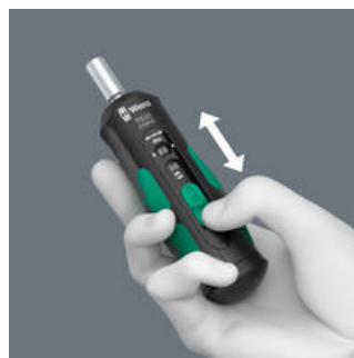
Einfache Einstellung der wählbaren Anzugsdrehmomente.