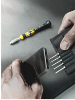
In praktischer Falttasche