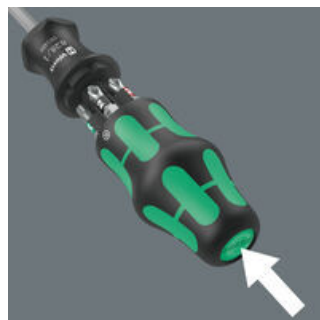
Der Griff kann über einen Betätigungsknopf geöffnet werden. Im Griff ist ein Magazin für 6 Bits integriert.