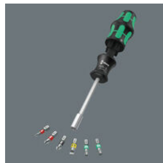
Das Griff/Wechselklingen-System lässt blitzschnellen Austausch der benötigten Klinge und damit vielfältige Anwendungen zu.