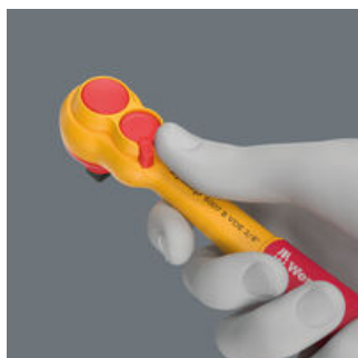
Dank des Umschalthebels ist der Richtungswechsel schnell und bequem möglich.