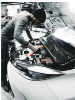
Zyklop Knarre und Zubehör für Elektriker