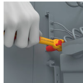
Durch ihre extrem schlanke Bauform ermöglicht die Zyklop VDE-Knarre einfaches Arbeiten auch in sehr engen Bauräumen.