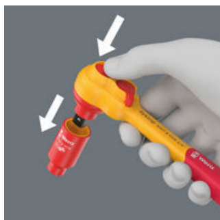
Die Kugelarretierung sorgt für sicheren Sitz der Nüsse und des Zubehörs und damit auch für verlässliche Sicherheit während des Verschraubens.