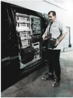
Wera 2go 1 - Der Dranpacker