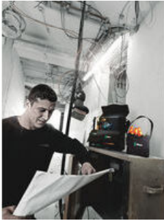
Wera 2go 4 Köcher