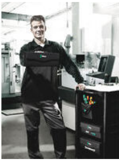
Wera 2go 3 - Der Drinpacker