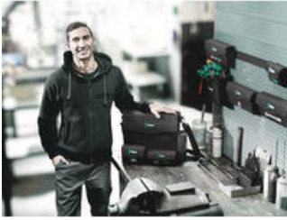
Wera 2go 2 - Der Dran- und Drinpacker