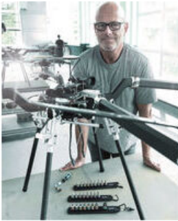
Die Wera Belts