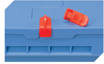
Verschluss-Clips für BITOBOX MB 6-20299