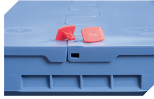
Plomben MBP2-L - für BITOBOX MB, XL, SL 6-19162