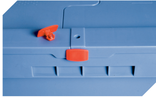
Plomben MBP2 - für BITOBOX MB 6-15705