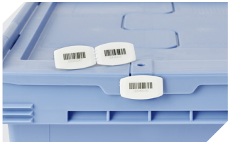
Barcode-Plomben MBP3 - für alle Mehrwegbehälter MB-Größen und XL-Behälter 800 x 600 mm 6-31550