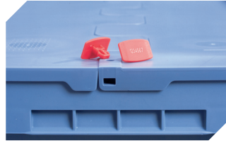
Plomben MBP2-L - für BITOBOX MB, XL, SL 6-19162