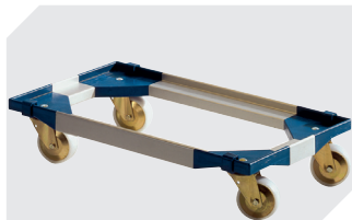
Transportroller für Mehrwegbehälter 800 x 400 mm und 800 x 600 mm L 720 x B 540 mm 6-19439