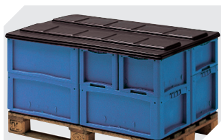
Palettenabdeckhauben L 1220 x B 820 mm 9-18421