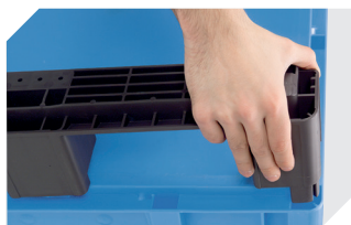
Kufensets für Eurostapelbehälter XL 43-20273