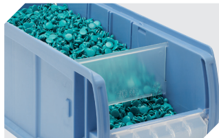
Dosierscheiben CDS für C-Teile-Behälter CTB - mm 53-31304