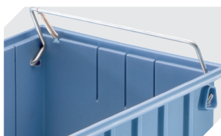
Sicherungs-/Tragebügel für Regalkästen RK und C-Teile-Behälter CTB 3-31314