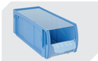
Staubdeckel CSD für C-Teile-Behälter CTB L 369 x B 148 mm 53-31342