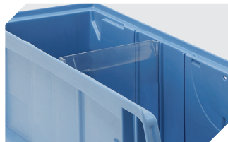
Querteiler CQT für C-Teile-Behälter CTB - mm 53-31303