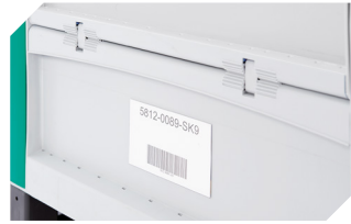
Etikettenhalter B 240 x H 80 mm 52-30386