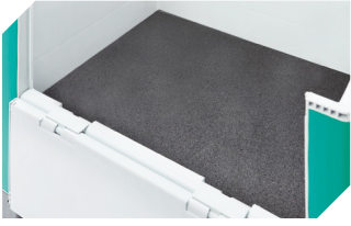
Antirutschmatten für Schwerlastbehälter SL L 720 x B 520 x H 8 mm 52-30380