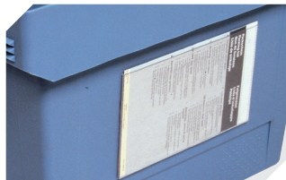
Etikettentaschen selbstklebend 3 Seiten offen L 175 x B 105 mm 6-5031