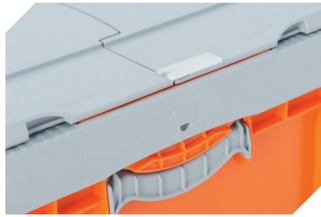
Plomben mit Laserbeschriftung für BITOKLAPPBOX EQ 51-31666