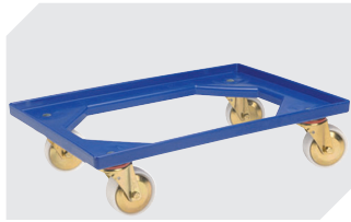
Transportroller Material Rad: PP L 620 x B 420 mm 43-1491