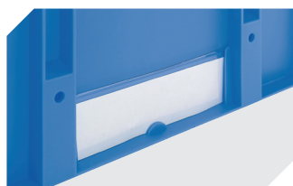
Etikettenabdeckungen für Mehrwegbehälter MB B 60 x H 80.4 mm 6-15244