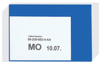
Etikettentaschen selbstklebend 2 Seiten offen L 145 x B 100 mm 46-21108