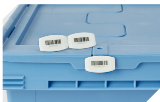
Barcode-Plomben MBP3 - für alle Mehrwegbehälter MB-Größen und XL-Behälter 800 x 600 mm 6-31550