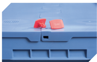
Plomben MBP2-L - für BITOBOX MB, XL, SL 6-19162