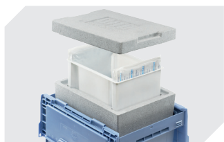
Thermo-Isolier-Sets für Mehrwegbehälter MB 77-31364