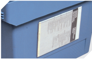
Etikettentaschen selbstklebend 3 Seiten offen L 175 x B 105 mm 6-5031