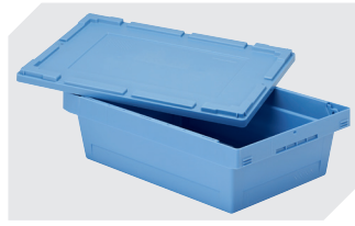
Stülpedeckel für Mehrwegbehälter MB L 400 x B 300 mm 6-30277