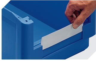
Schutzfolien für Sichtlagerkästen SK L 68,5 x B 12,5 mm 2-19547