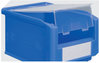
Verschlussdeckel für Sichtlagerkästen SK L 71 x B 97/76 mm 2-19545