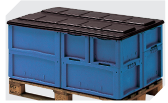
Palettenabdeckhauben L 1220 x B 820 mm 9-18421