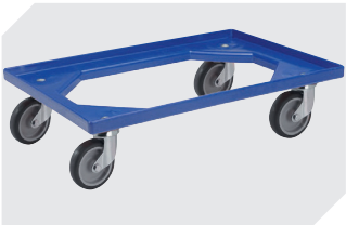
Transportroller Material Rad: Gummi L 620 x B 420 mm 43-21883