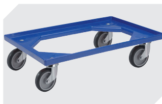
Transportroller Material Rad: Gummi L 620 x B 420 mm 43-21883