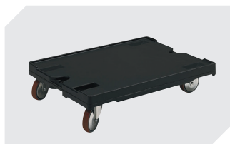
Transportroller für Behälter 800 x 600 mm L 800 x B 600 x H 198 mm 43-1150