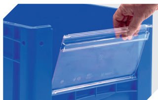
Sichtscheiben für Eurostapelbehälter XL B 460 x H 248 mm 43-30266