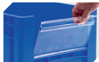
Sichtscheiben für Eurostapelbehälter XL B 460 x H 248 mm 43-30266