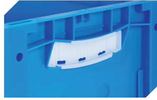
Griffverschlüsse für Eurostapelbehälter XL Höhe 170, 220 und 270 mm 43-31450