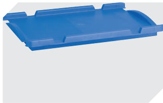
Auflagedeckel für Eurostapelbehälter XL L 300 x B 200 mm 43-30392