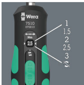
Fünf wählbare Anzugsdrehmomente (1,0; 1,5; 2,0; 2,5; 3,0 Nm) und eine Fest-Stellung (Torque Lock) für unbegrenzte Löse- und Anzugsmomente.