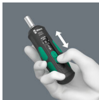
Einfache Einstellung der wählbaren Anzugsdrehmomente.