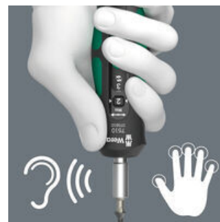
Deutlich hör- und spürbares Überrasen beim Erreichen des eingestellten Drehmomentes.