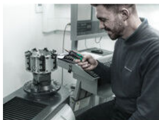
Drehmomentschraubendreher mit Schnelleinstellung