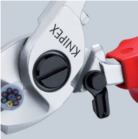
95 26 165: Sperrklinke verriegelt Scheren mit innenliegender Öffnungsfeder

Kabelschnitt mit Kabelschneider: leichter, sauberer Schnitt ohne Verformung des Kabels