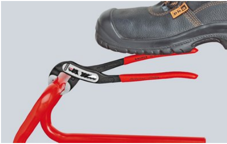
Selbstklemmend an Rohren und Müttern: kein Abrutschen am Werkstück; die gesamte Betätigungskraft kann zum Drehen der Werkstücke eingesetzt werden; festes Zusammendrücken der Zangenschenkel ist nicht erforderlich, dadurch weniger Kraftaufwand