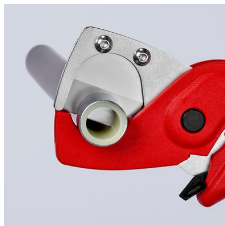
Das hochfeste, scharfe Messer schneidet Verbund- und Kunststoffrohre glatt und gratfrei