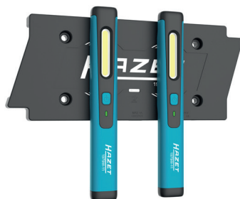
Kabellos / Wireless