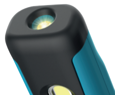
Top Licht / Top lamp