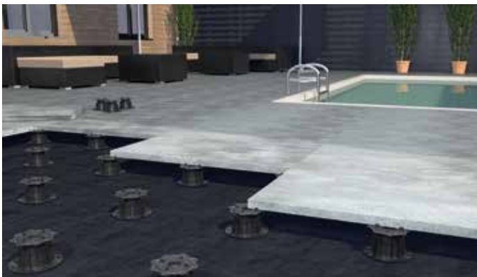
Der GIANT M unter einer Steinterrasse verbaut.