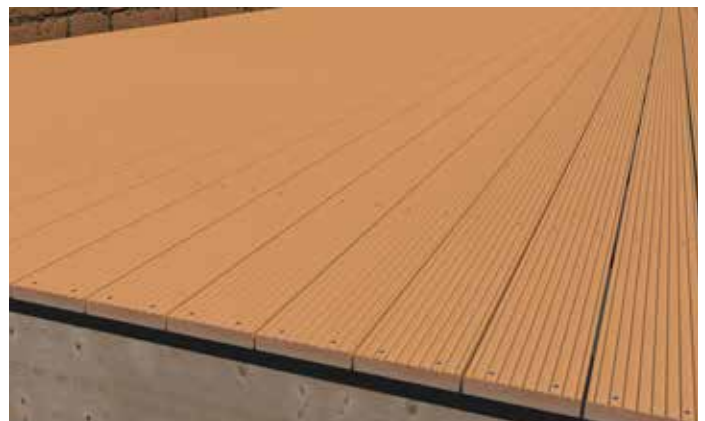
Das Protectus Holzschutzband unter einer Holzterrasse.