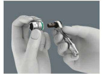
Bits und Nüsse. Bits kann ich direkt aufstecken. Ich kann auch erst einen Halter einstecken, der dann den Bit führt. Dieser dient dann ebenfalls als Verlängerung mit freilaufender Führungshülse. Für Nüsse brauche ich einen Adapter 1/4" Sechskant auf Vierkant, z. B. Wera 870/1 (im Bit- Check und bei der einzelnen Bit- Ratsche im Set enthalten).