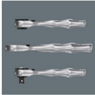
Die niedrige Höhe ist ideal für alle besonders engen Einbausituationen.