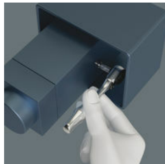
Die Mini-Ratschen für alle schwer zugänglichen Anwendungsfälle.