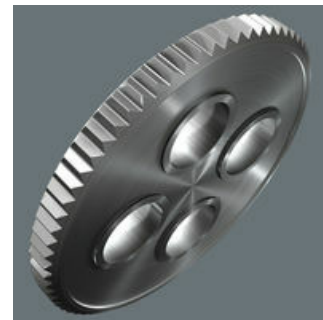
Feinzahnmechanik mit 60 Zähnen ermöglicht einen kleinen Rückholwinkel von 6° für präzises Arbeiten.