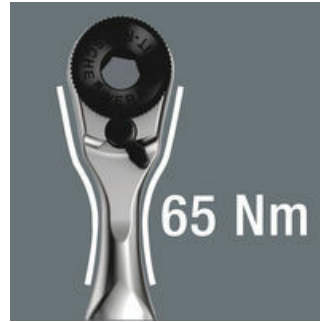
Der Zyklus Mini hält mindestens 65 Nm aus, das ist weit mehr, als man normalerweise an Kraft auf so ein kleines Werkzeug übertragen kann.