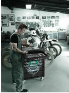
Exklusiver Werkstattwagen im Tool Rebel Design