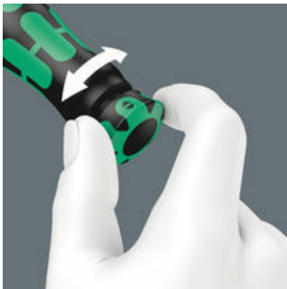
Mit hör- und fühlbarem Einrasten bei Erreichen der Skalenwerte.