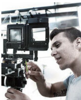
Mit Haltefunktion für Innen TORX® Schrauben