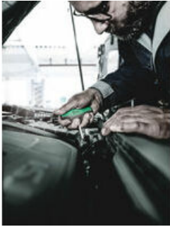
Schraubendreher mit Quergriff