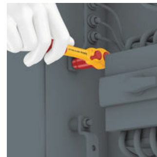
Durch ihre extrem schlanke Bauform ermöglicht die Zyklop VDE-Knarre einfaches Arbeiten auch in sehr engen Bauräumen.