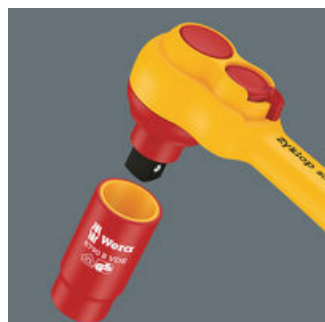
Die Kugelarretierung sorgt für sicheren Sitz der Nüsse und des Zubehörs und damit auch für verlässliche Sicherheit während des Verschraubens.