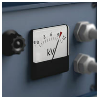
Die Stückprüfung der Zyklop Werkzeuge für Elektriker bei 10.000 Volt gemäß IEC 60900 garantiert sicheres Arbeiten unter Spannung bis 1.000 Volt.