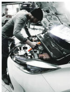
Zyklop Knarre und Zubehör für Elektriker