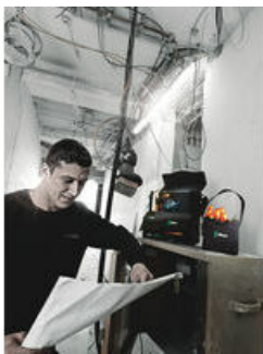
Wera 2go 4 Köcher