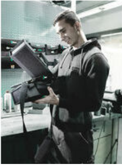
Wera 2go 1 - Der Dranpacker