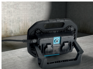
Für ideale Raumausleuchtung / for perfect room illumination