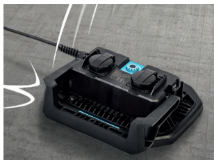
Stoßfestigkeit / shockproof: IK 07

Mit 2 Steckdosen max.230 V, 13 A output with 2 plugsocket max.230 V, 13 A output