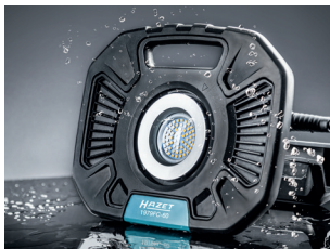
Spritzwassergeschützt / waterproof: IP54